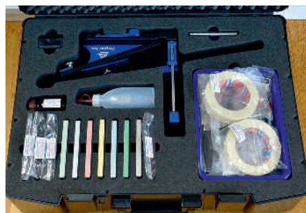
An wirklich alles und jedes gedacht: Hochwertiger Kunststoffkoffer mit mehr als umfangreicher Zubehöerausstattung.