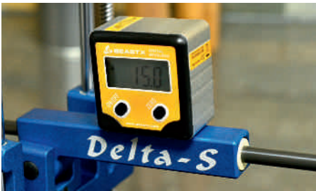
Supergenau und unabhängig vom Verschleiß der Schleifsteine: elektronischer Neigungsmesser zur Winkeleinstellung.