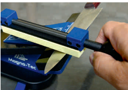
Einfache Praxis: Die Klinge ist positioniert, der Winkel eingestellt, jetzt muss man nur noch den Stein drüberziehen.

Trotz der Verkleinerung des Delta-S ist der Kunststoffkoffer, in dem das Gerät geliefert wird, wirklich groß. Der eigentliche Schärfer nimmt darin nur einen kleinen Teil ein, der Rest wird für das Zubehör gebraucht, für das der Begriff „umfangend“ eine glatte Untertreibung ist. Mitgeliefert werden sieben japanische